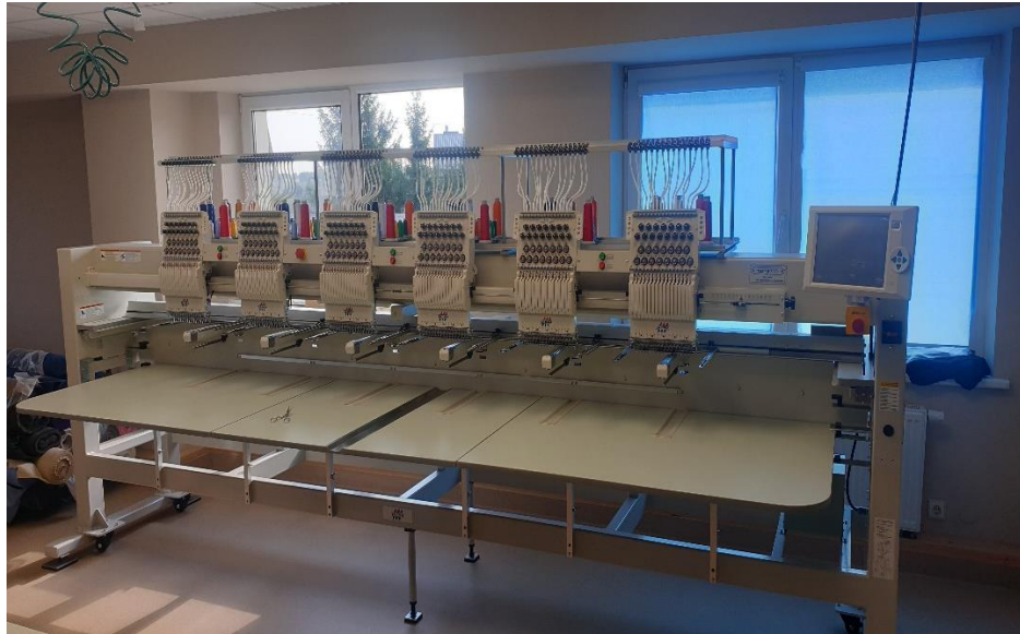
1 pav. UAB „Midateksas“ įsigyta įranga (siuvinėjimo mašina)