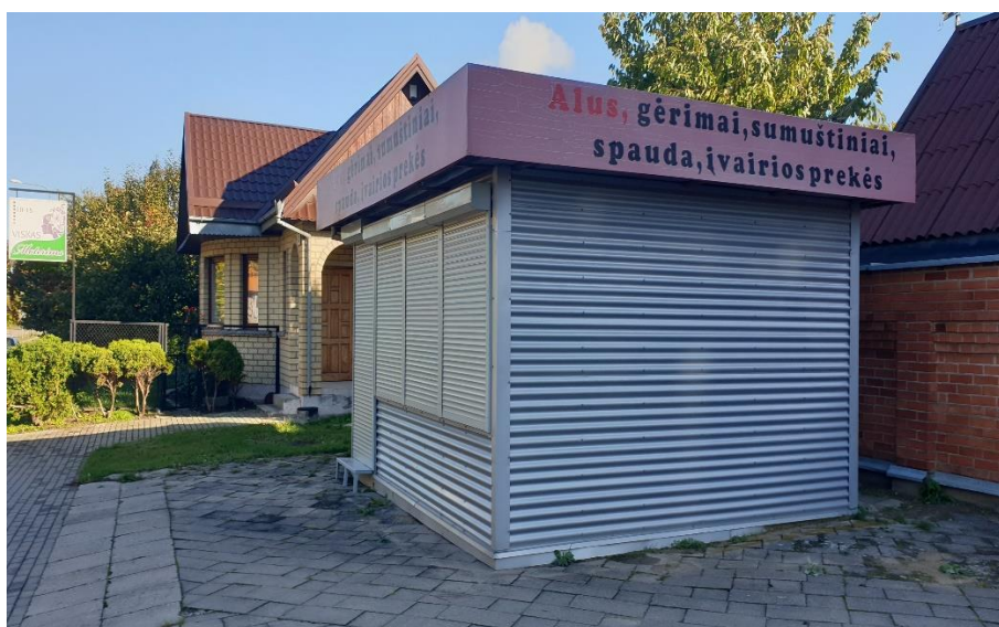
3 pav. MB „Maistoma“ nurodyta veiklos vykdymo vieta