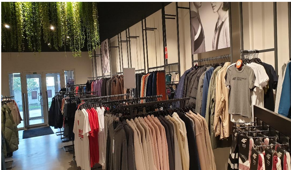
2 pav. MB „ALL4U“ įsigyta įranga (prekybiniai baldai)